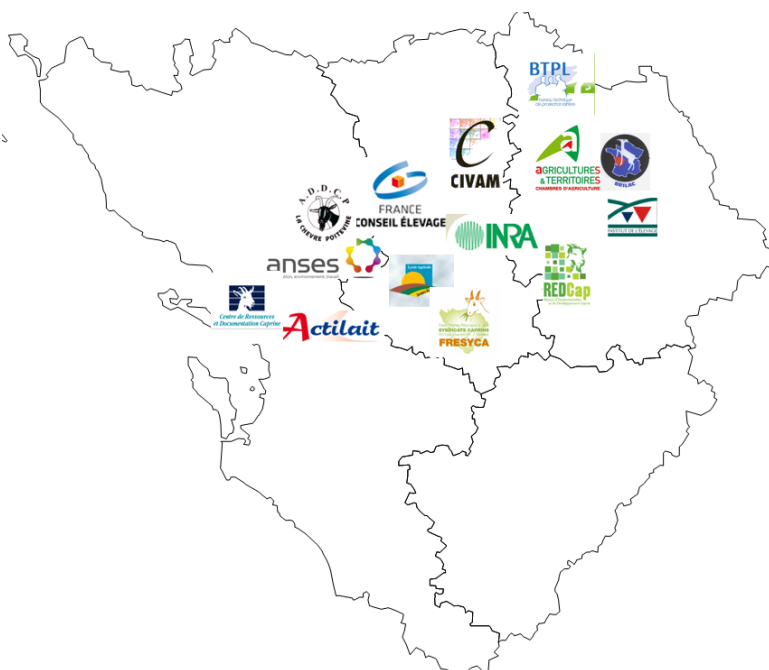
Figure : carte des membres de R&D du Réseau d'Excellence Caprine localisés en Charentes-Poitou