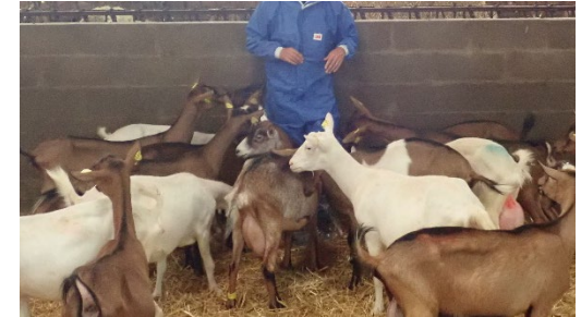
Test vis-à-vis d'un humain immobile