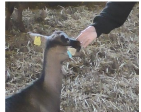
Contact lors du test d'approche